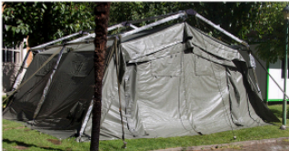
TIENDA MODULAR DE DESPLIEGUE RAPIDO DE 6 m. X 6 m.

Complementos: Equipo de iluminación, repuestos y herramientas, instrucciones, bolsas de lona y de estructura y cajones de transporte. Dossier completo de pruebas de laboratorio y cálculo de ingeniería